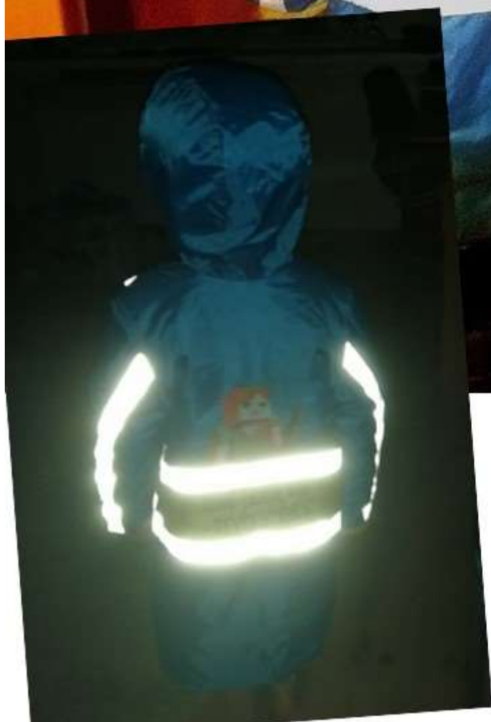
Группа №7, куртка сшита мамой+ нашивки